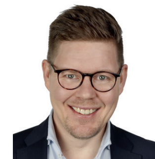
ANTTI LINDTMAN antti.lindtman@vantaa.fi

Tikkurilan SDP:n Vantaan kaupunginvaltuutetut sekä aluevaltuutetut